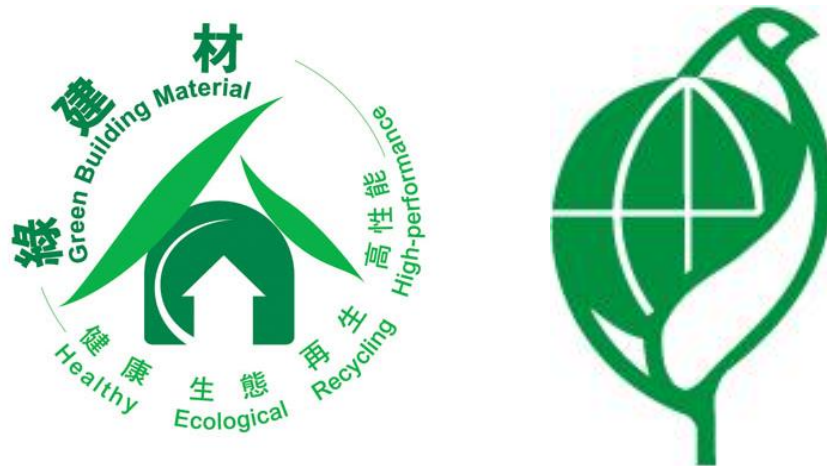
圖2 綠建材標章（左）、環保標章（右）