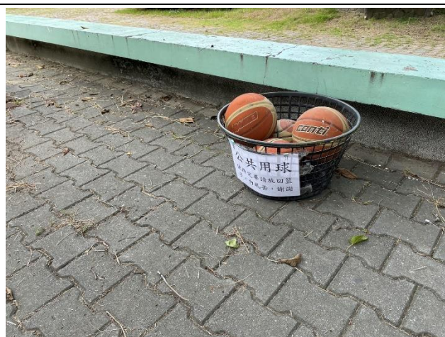
說明：校園提供公共球，供同學下課使用