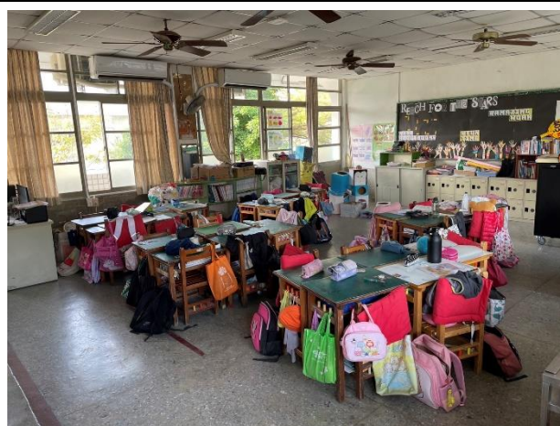
說明：實施下課教室不留人