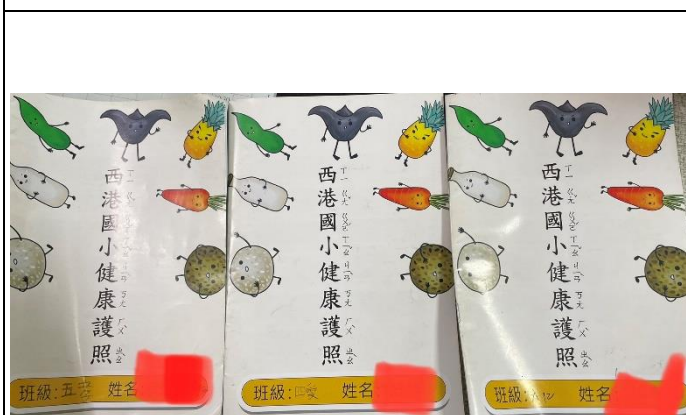
說明：西港國小健康護照封面