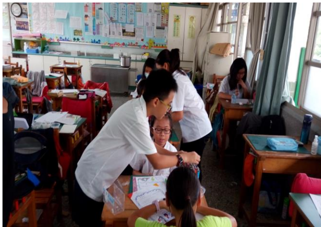
小小夢想家學習單書寫