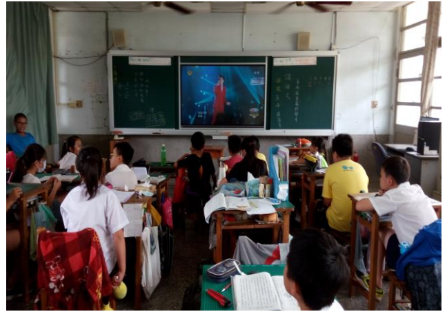
勵志歌曲欣賞-我的未來不是夢