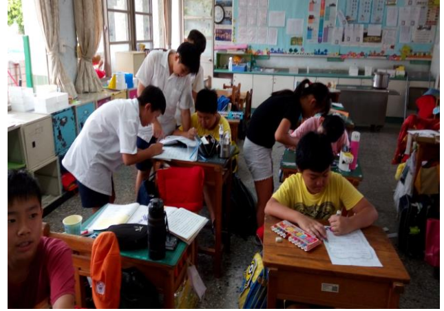
小小夢想家學習單書寫