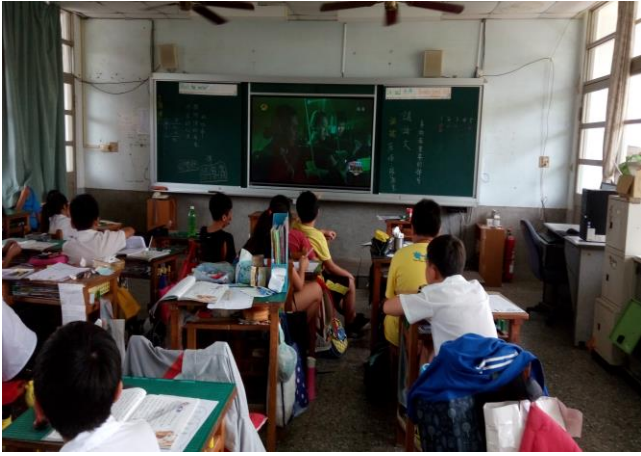
勵志歌曲欣賞-夢想從心開始