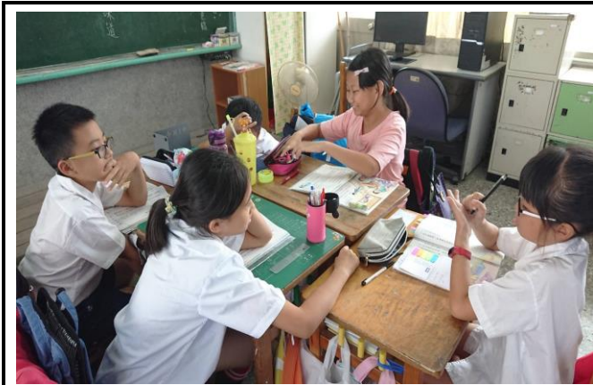
分組討論及自我提問