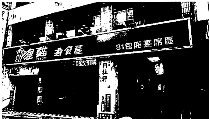
所在大樓一樓外觀

因停車位較少且拖吊開單頻繁，建議採用大眾運輸工具前往：可搭乘捷運板南線，由忠孝新生站 2 號出口，徒步前往約 2 分鐘；中和新蘆線則建議由忠孝新生站 5 號出口，徒步前往約 2 分鐘。