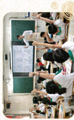
小朋友現場踴躍參與