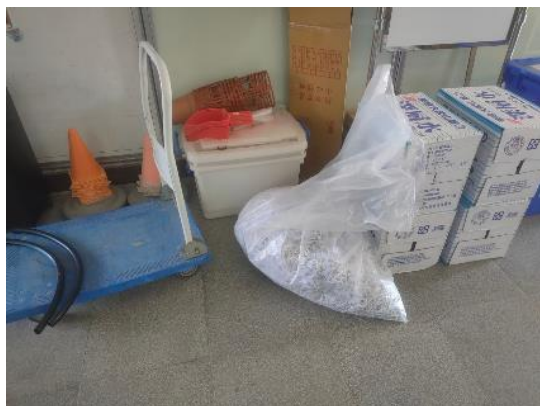
圖片說明：碎紙機旁放置碎紙回收