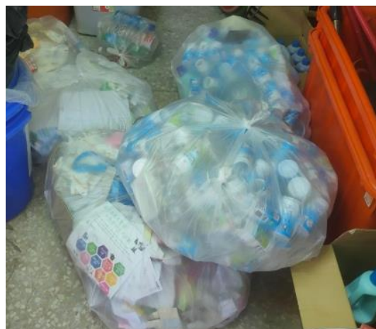
圖片說明：回收後回收物集中地點