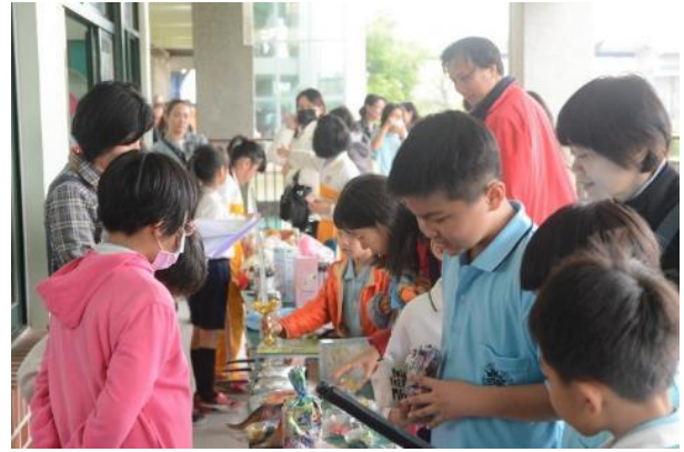
圖片說明：108 學年度校慶跳蚤市場