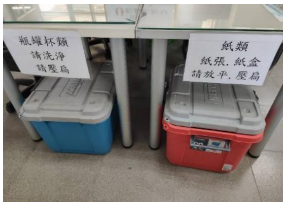
圖片說明：設置辦公室的回收桶