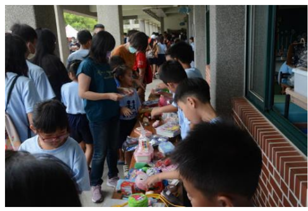
圖片說明：109 學年度校慶跳蚤市場

華山基金會 台南A區辦公室 704台南市北區北成路488號 電話：(06)252-6658 傳真：(06)252-0628 www.stider.org.tw