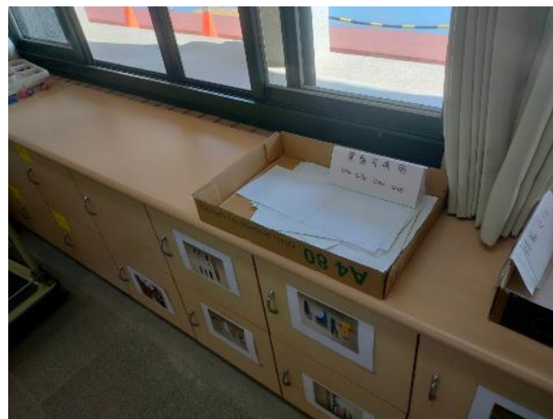
圖片說明：影印機旁放置單面紙回收處