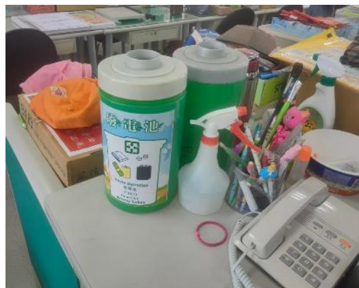
圖片說明：辦公室放置廢電池回收桶