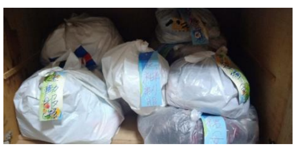
圖片說明：舊校服回收衣物分類保管