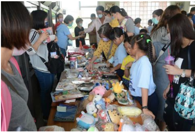
圖片說明：109 學年度校慶跳蚤市場