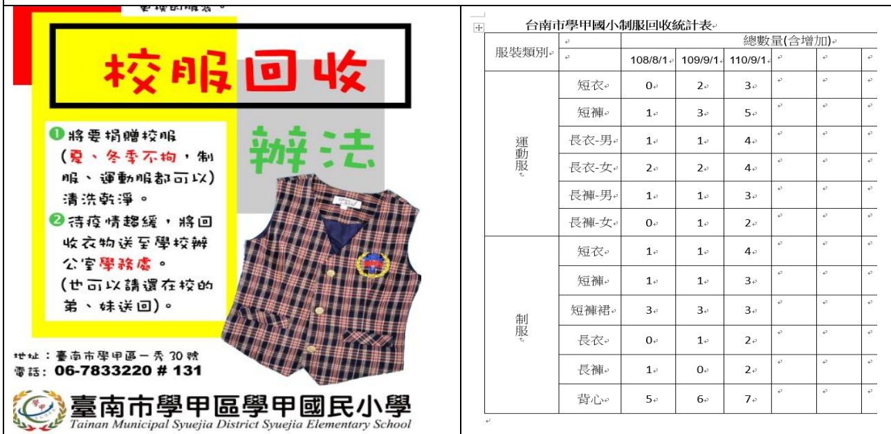
圖片說明：校服回收活動海報