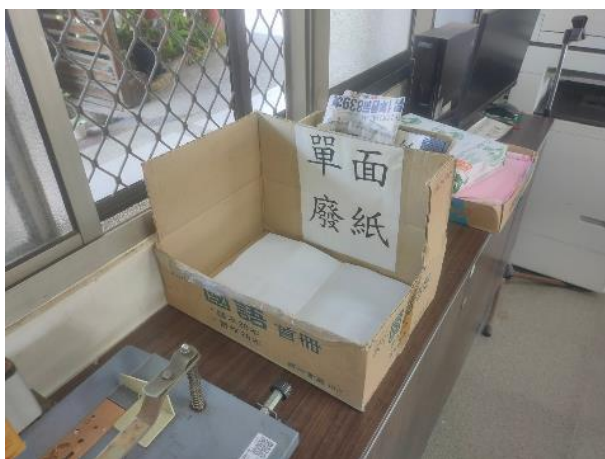
圖片說明：影印機旁放置單面紙回收處