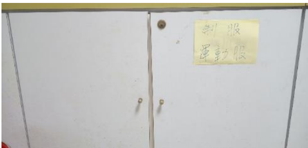
圖片說明：舊校服回收衣物保管櫃