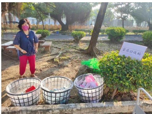
圖片說明：校園回收站的地點