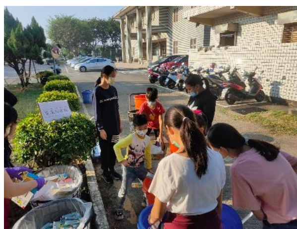
圖片說明：學生每週三至回收站做回收