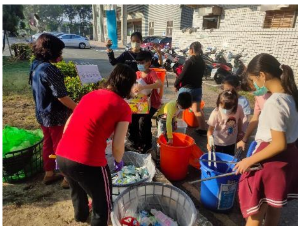
圖片說明：學生每週三至回收站做回收