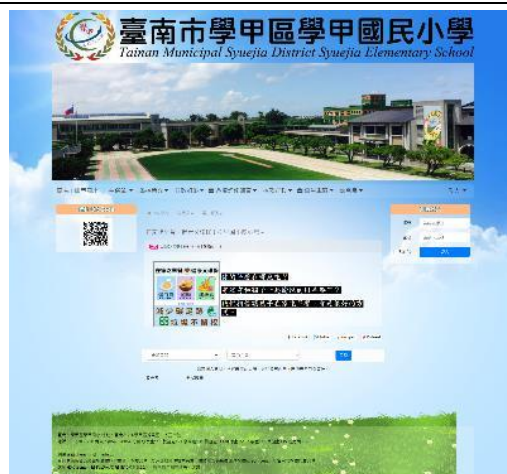
圖片說明：學校網站宣導在家吃早餐