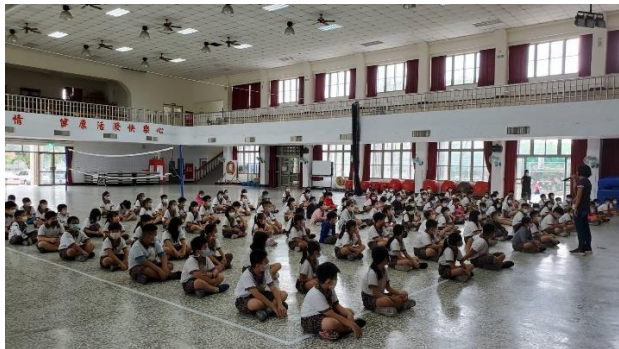
圖片說明：全校性宣導在家吃早餐