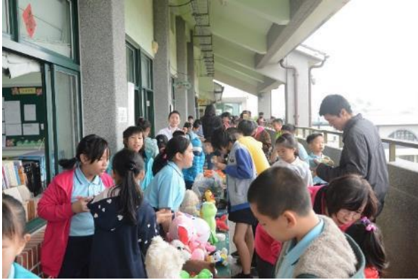
圖片說明：108 學年度校慶跳蚤市場