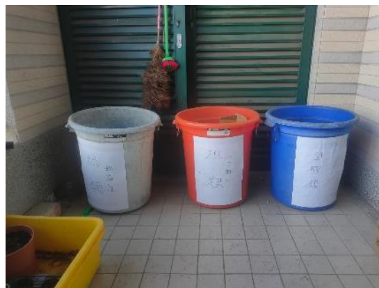
圖片說明：設置在教室的回收桶