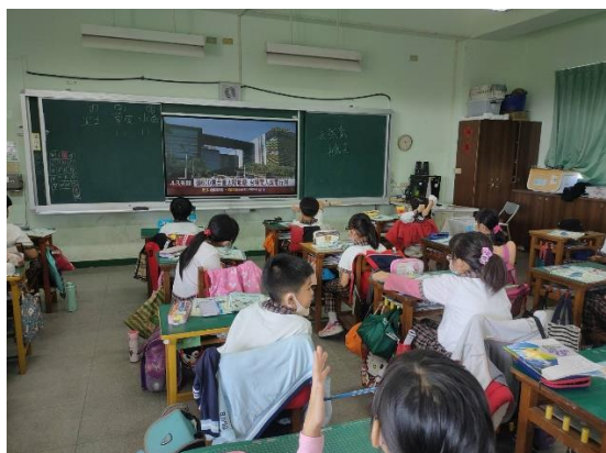
圖片說明：四年級太陽能發電課程