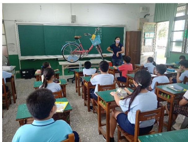
圖片說明：五年級介紹腳踏車發電課程