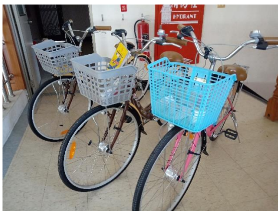
圖片說明：學校的發電腳踏車