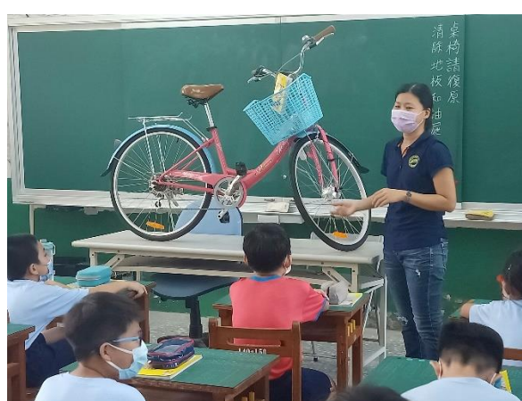
圖片說明：五年級介紹腳踏車發電課程