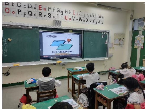
圖片說明：四年級太陽能發電課程