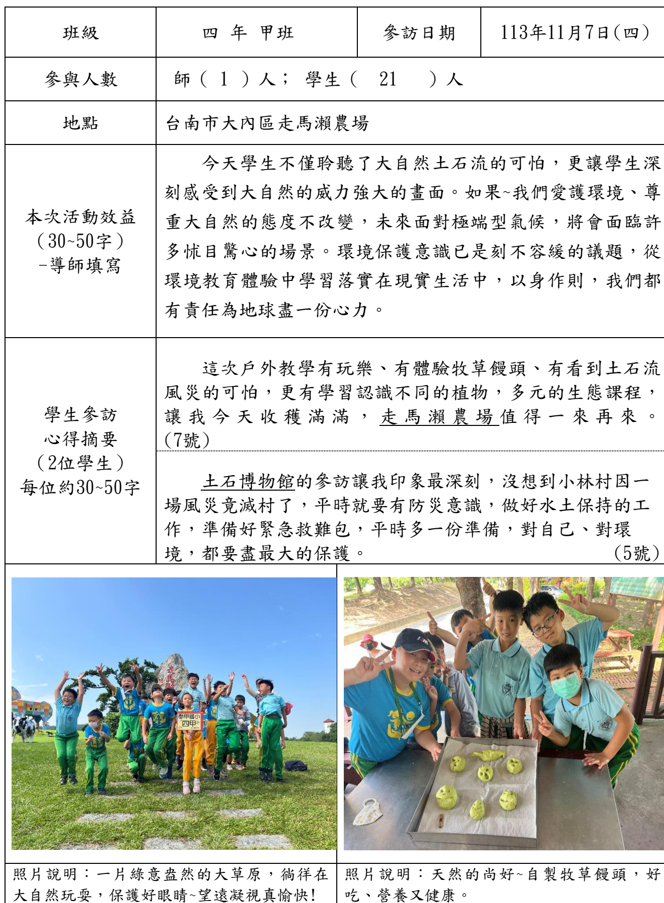
台南市學甲國小參訪環境教育設施場所班級成果表