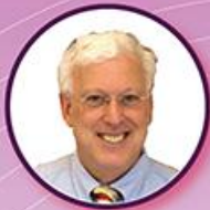
Prof. Robert J. Sternberg Cornell University, USA

Transformational Giftedness, and Why Our Conventional Definition of Giftedness Has Become a Disservice to Humanity