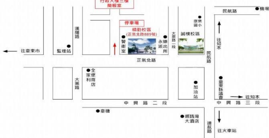
國立臺東專科學校校園平面圖