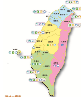
圖式一覽表 ● 失能家庭：兒童服務 ● 失能家庭：成人服務 ● 失能家庭：新移民服務 ● 失能家庭：社區服務 ● 失能家庭：專業工程社區服務 ● 弱勢社區：服務學習 ● 團體服務：愛心轉轉轉