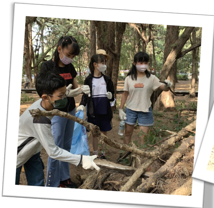
◇ 為森林中的生物搭一個避難所