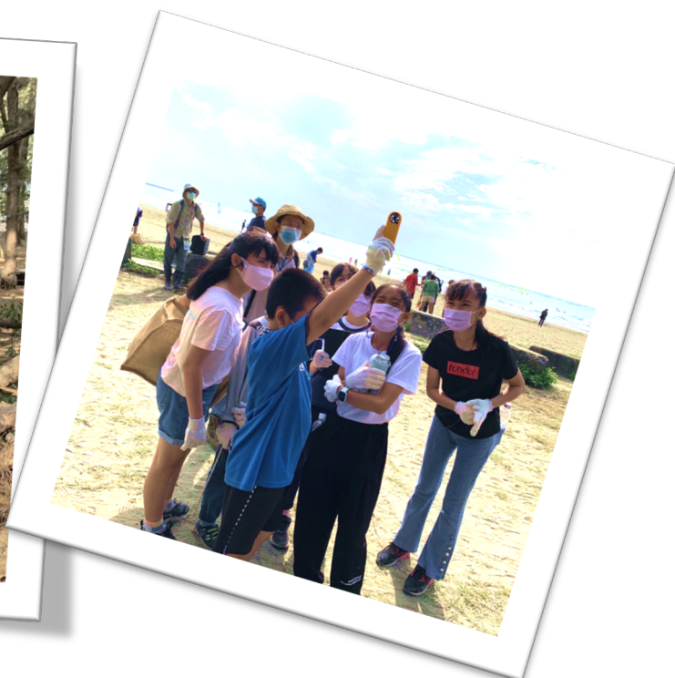
◇ 成為海岸森林的調查員