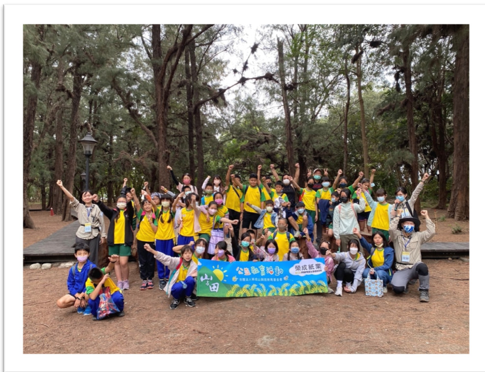
◇ 帶孩子們一起來認識海岸森林吧！