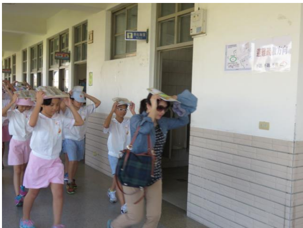
地震稍歇-以書包保護頭部，聽從師長指示，依平時規劃路線進行避難疏散。