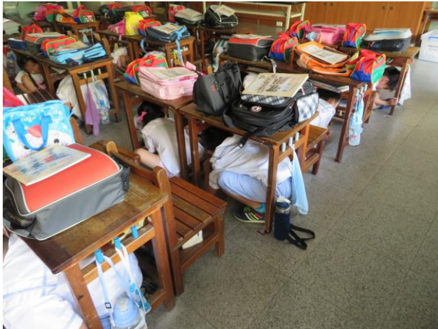
地震發生就地掩護 -躲在桌下，保護頭部。