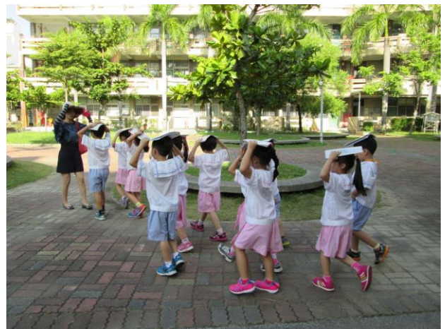
不語、不跑、不推，在師長引導下至安全疏散地點集合。