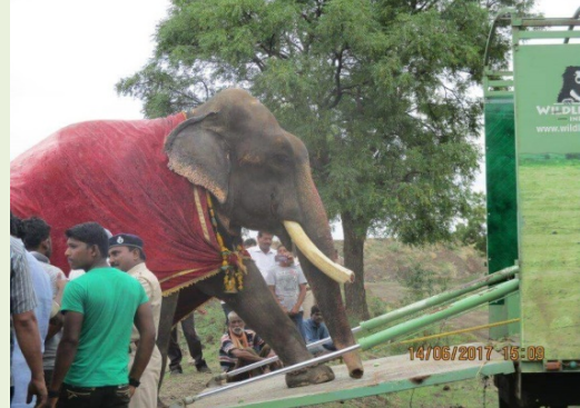
上圖：Gajraj 被鍊乞討受虐 51 年