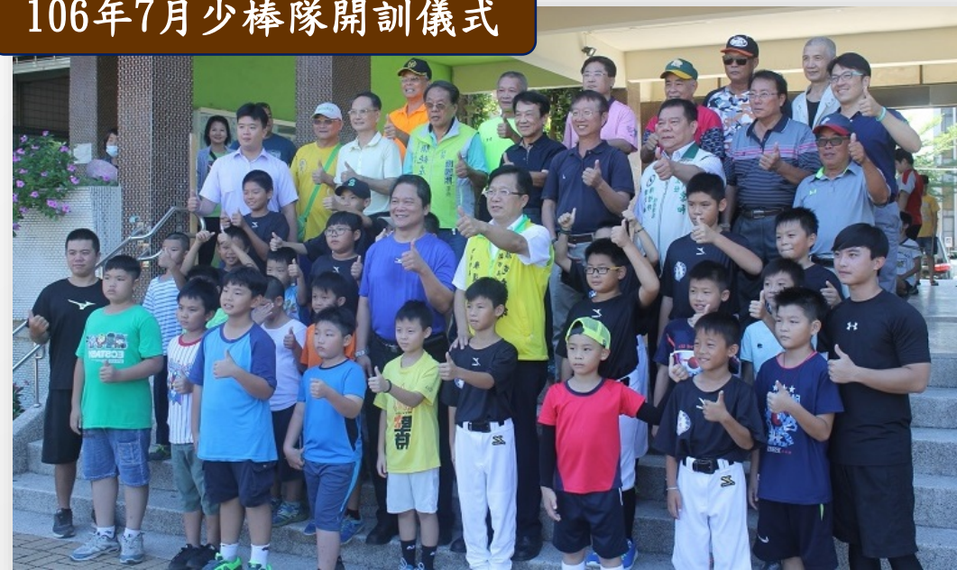
106年7月少棒隊開訓儀式

省躬國小於民國60年代曾經籌組過棒球隊，且有過輝煌的成績。為使省躬少棒隊風華再現，便重新籌組成立棒球隊，並於學區內學校用地上，新建省躬國小專用棒球場，期待省躬少棒隊戰績能夠再度輝煌風華再現。