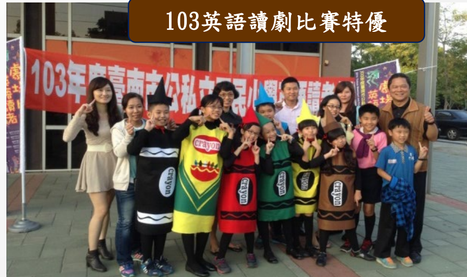
103英語讀劇比賽特優

省躬國小位於灣裡社區，是個部落型的學校，早期先民以漁維生，因而社區內廟宇林立，為結合在地資源發展學校特色，便成立戰鼓隊、醒獅團。同時，為發展語文教育和推動第二官方語言，而成立相聲社和英語讀劇社。