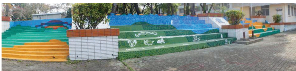
全校師生共同完成美麗的校園彩繪