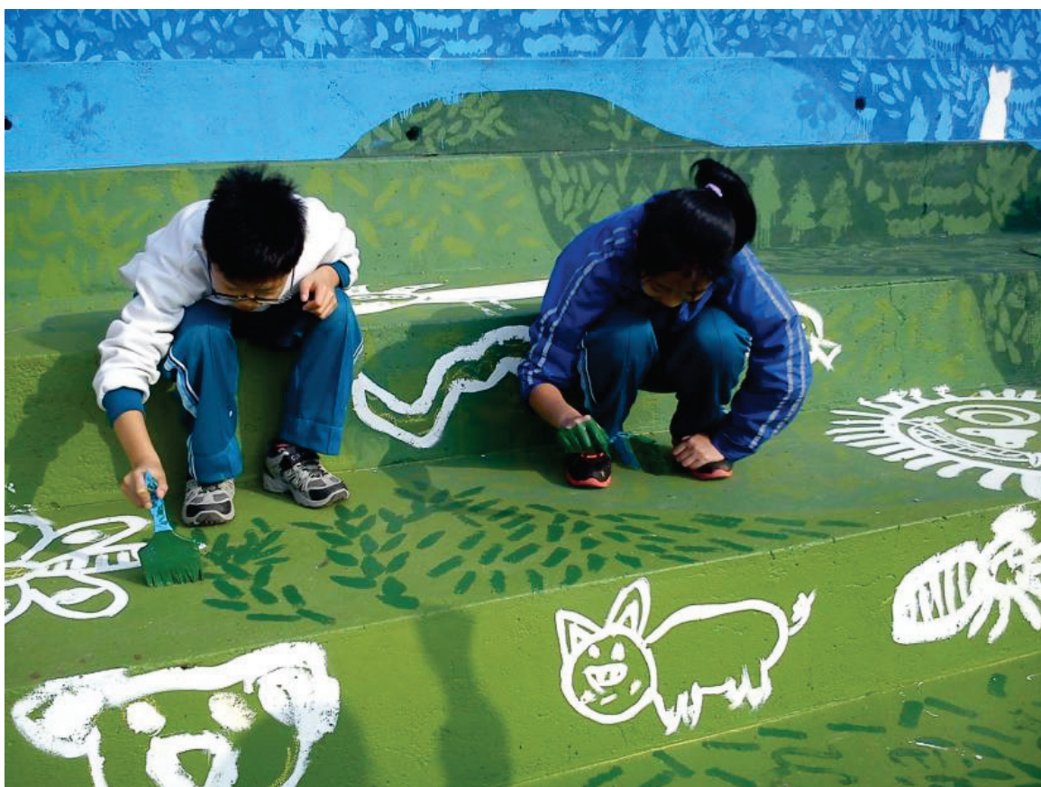
一年級藝術深耕課程彩繪校園--操場看台階梯