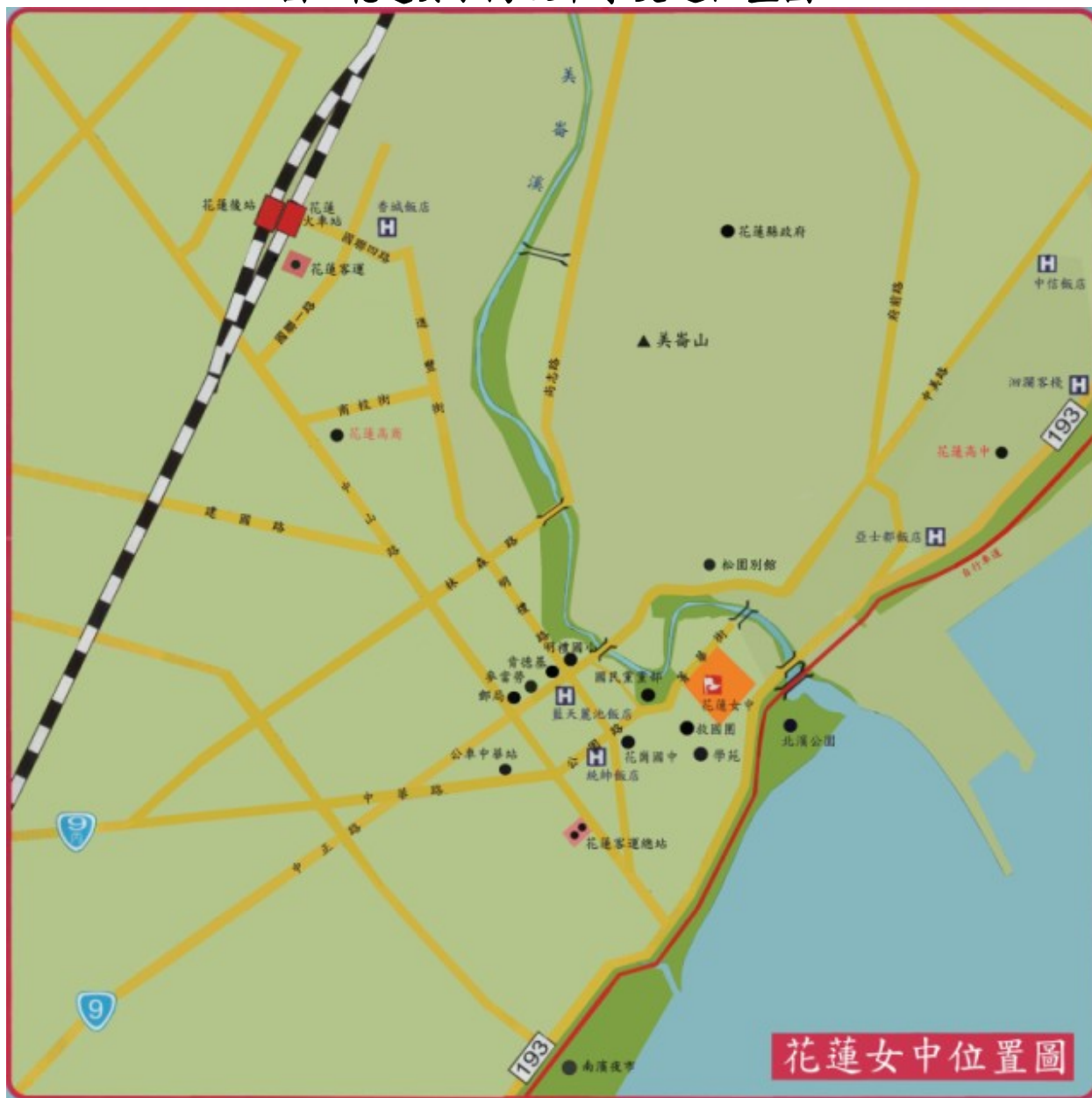
國立花蓮女子高級中學交通位置圖