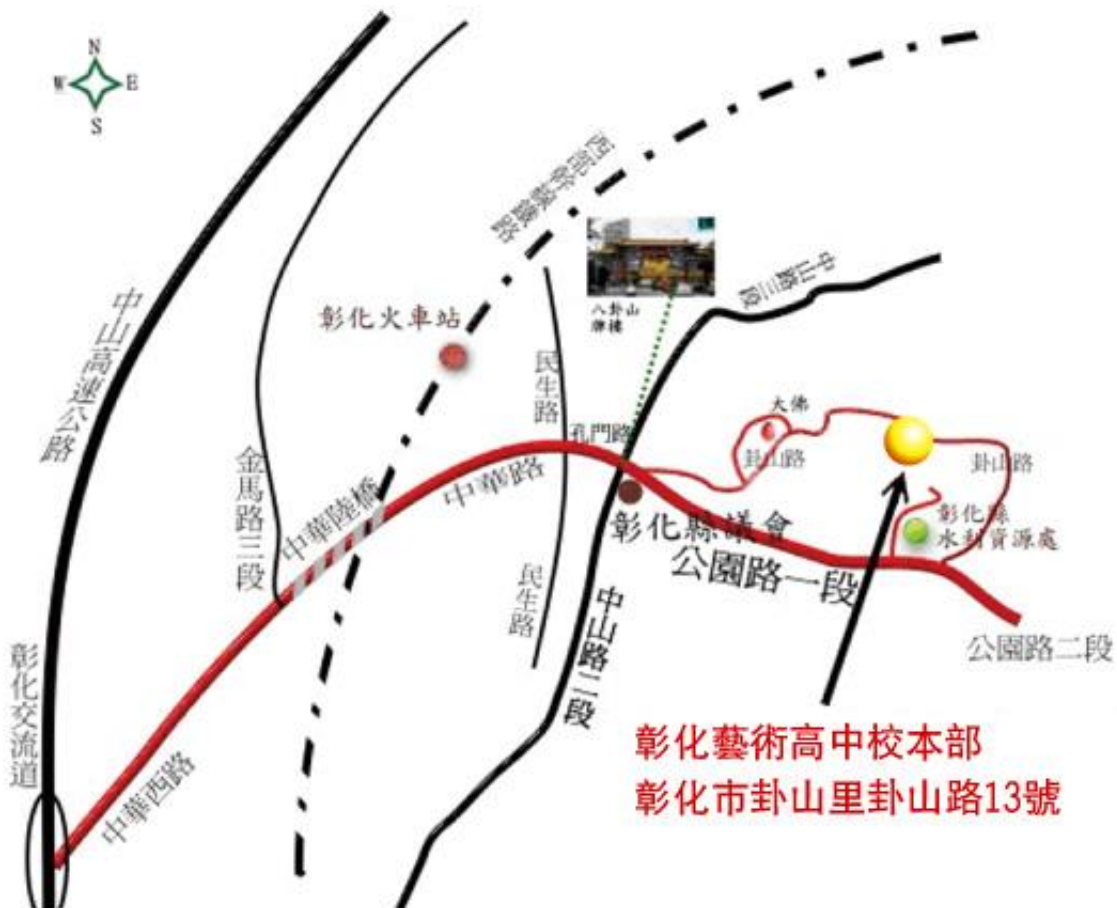
附圖、彰化縣立彰化藝術高級中學位置交通路線簡圖