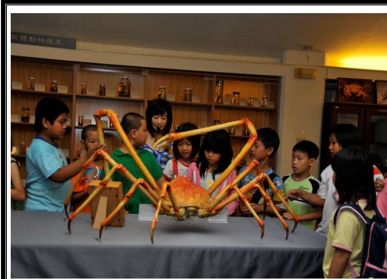
解說員帶領學生製標 本室參觀

標本室典藏標本包含軟體動物、魚類、甲殼類、海洋哺乳類、深海生物、底棲性生物、海鳥類、海洋無脊椎生物、棘皮生物等項目，透過標本民眾不但可近距離觀察生物，標本的典藏與展示更提供民眾一窺平日難得一見的各式海洋生物的機會。在標本室解說員除解說基礎生物知識外，亦會分享製作標本過程中各種酸甜苦辣的有趣故事，使解說更加生動活潑，加深學生學習印象。