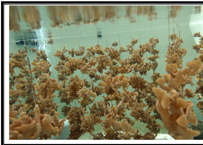
珊瑚培育區石珊瑚養殖實景

珊瑚礁生態系是海洋中生物種類最多、生產力最高的所在，為減緩野外採捕的壓力並提供館內研究使用，本館利用自行研發之繁殖技術大量培育各種珊瑚，其間並取得多項培育專利；本館依不同珊瑚之特性，採用簡單吊掛法及軟珊瑚基座附著法來培育。C1-1~C1-3 缸體為方型水槽，面朝走道之水槽側邊有玻璃觀景窗，可供參觀人士更近距離觀賞缸裡的生物。當珊瑚母株進行分株後，新生代的珊瑚子株會被移至此處進行隔離觀察，待吊掛成串的珊瑚子株肉質組織癒合完全，以及軟珊瑚和基座緊密結合之後，再將成這些珊瑚移至大型的池區蓄養。