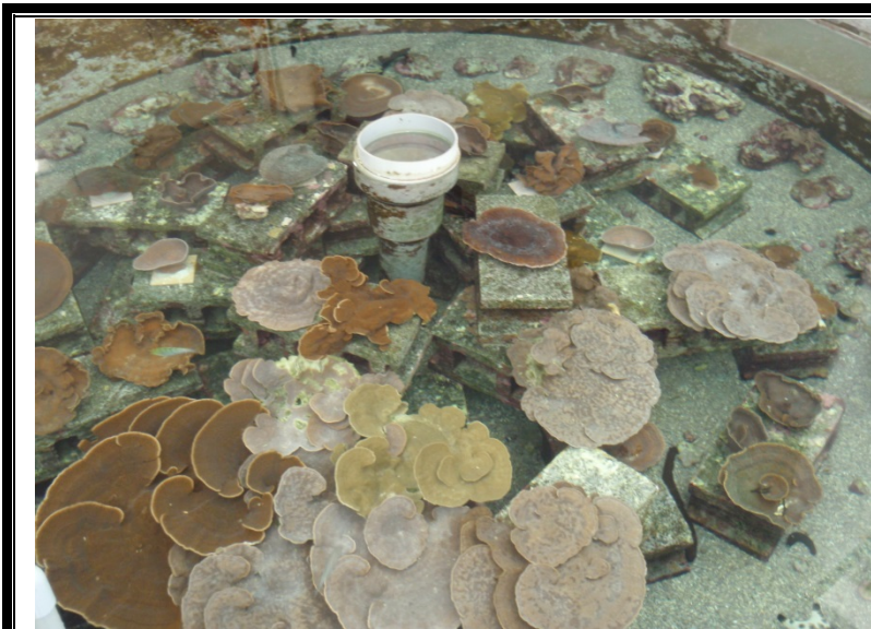
堆放式珊瑚培育區實景

選用瓷磚或盆栽容器等低價的材質做為培育的基座，使珊瑚飼育的空間利用上更佳具有彈性，擺放於基座上的珊瑚姿態也將更具美感。