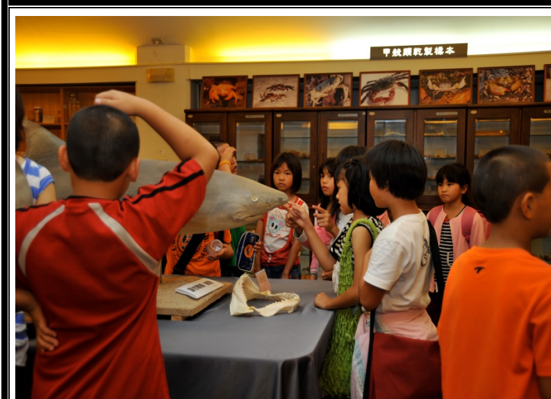
學生對標本展現濃厚 的興趣