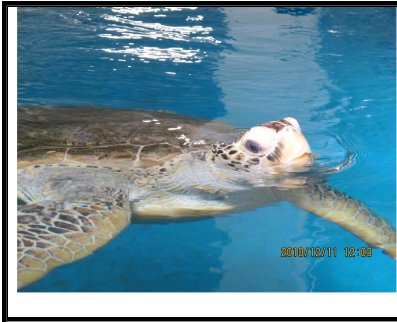
海龜收容中心內收容之綠蠓龜