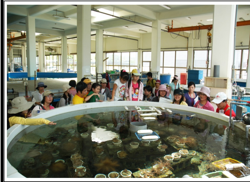
解說員帶領學生參觀珊瑚培育區