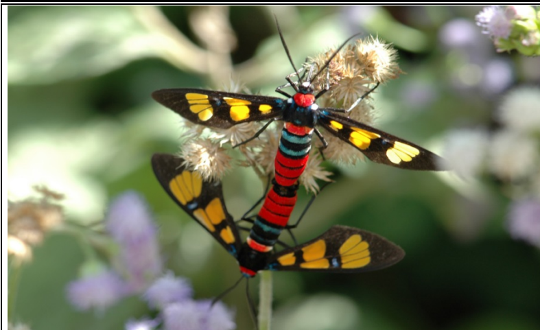
色彩繽紛的紅腹鹿子蛾