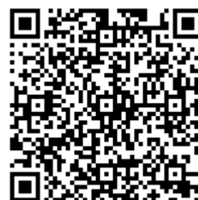
報名 QR 碼 ↑

聯絡電話:06-6226111 轉 760、769、763 敏惠醫專牙體技術科 王正鳳 、 薛亞銘 老師