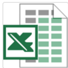
1) 第51屆校慶運動會報名表.xls