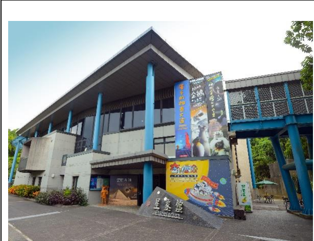
南瀛天文館-星象館