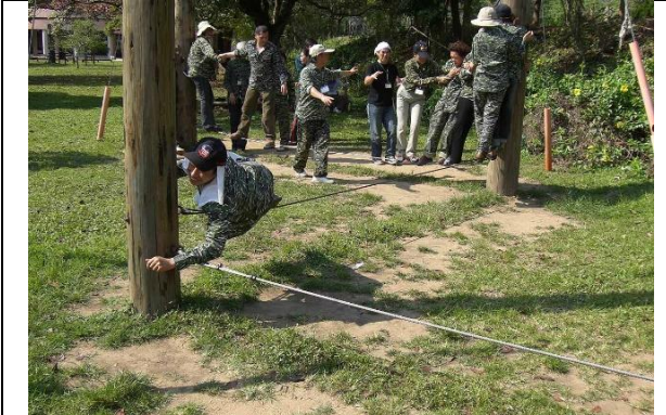
曾文生態團康活動