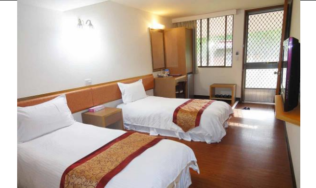
曾文青年活動中心旅店-環保住宿