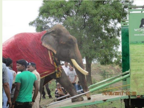
上圖：Gajraj 被鍊乞討受虐 51 年