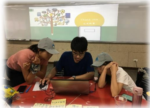
教案活動設計指引撰述