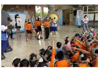
2021 年桃園市內定國小