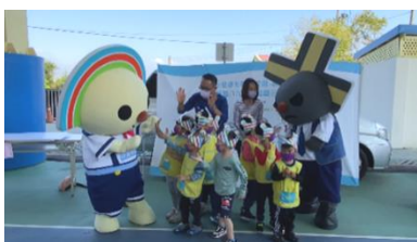
台南市中洲國小 與 OPEN 小將、LOCK 小醬合照