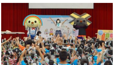
高雄市博愛國小 帶動跳搖擺健康舞

※110~111 年度「千禧健康 OPEN 小將、LOCK 小醬」出動到校園花絮：