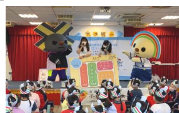
桃園市大湖國小 飲食營養衛教互動遊戲