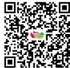
掃 QR Code 申請講座