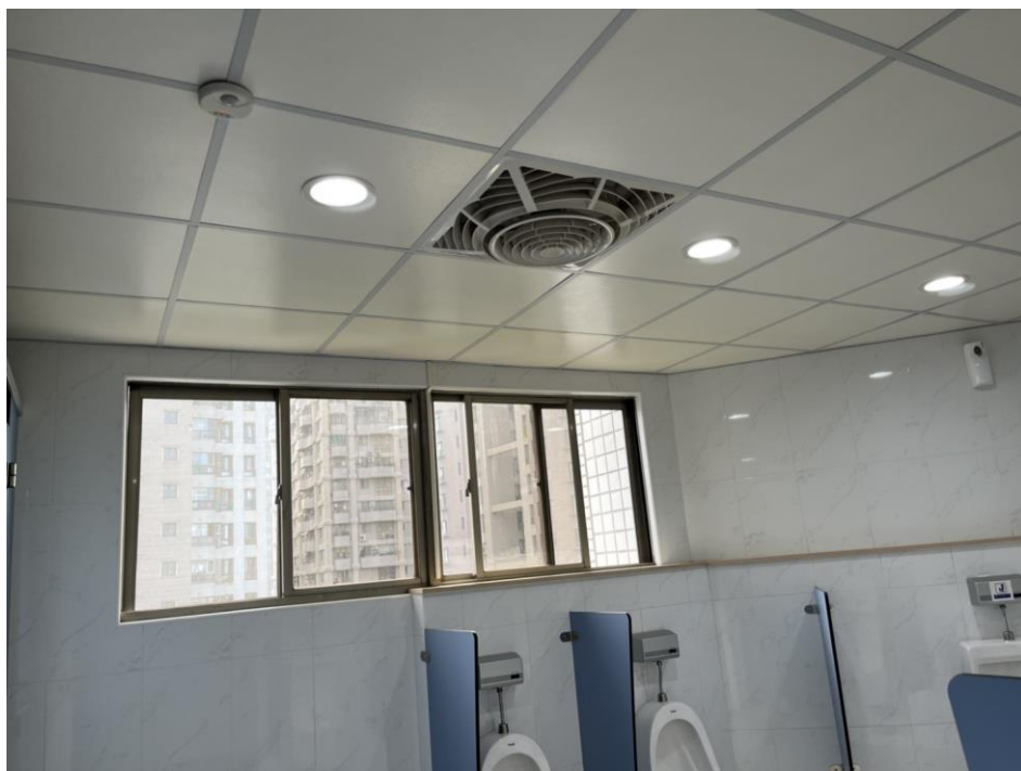
圖6 廁所排風與開窗配置（示意）