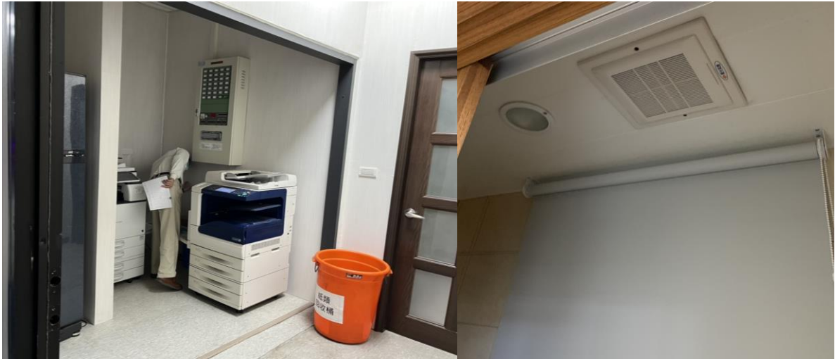
圖7 影印機及排風扇設置 (示意)