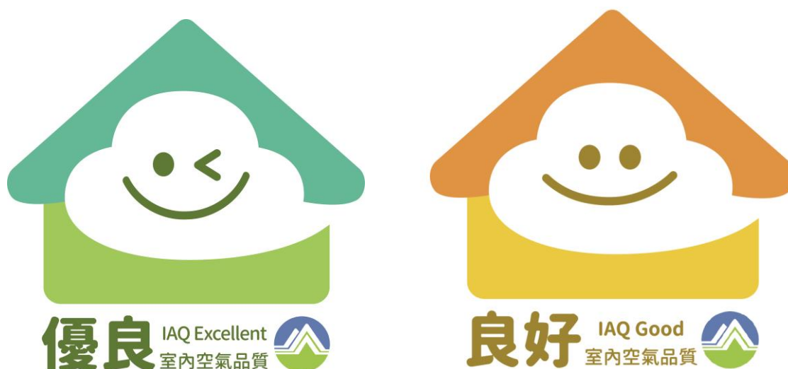
圖10 室內空氣品質自主管理標章 優良級(左)、良好級(右)

本要點明定公私場所之自主管理標章分級、申請、審查、使用管理等事項，詳見附件一所示。凡申請標章，應營造優質室內空氣品質，據以執行維護管理計畫，並委請環保署認可之檢驗測定機構依「公告場所室內空氣品質檢驗測定管理辦法」進行檢測後，出具合格檢測報告，可申請標章，如符合本要點規定，經直轄市、縣（市）主管機關審查同意後，將授予標章使用權，並可張貼標章於場所出入口，提高企業品牌形象。標章申請流程及標章規範如圖11及圖12所示。