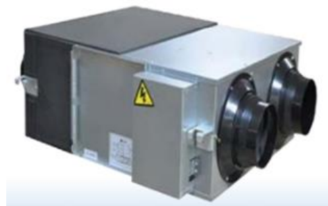
圖4 全熱交換器（示意）