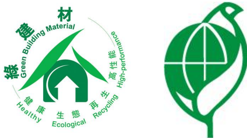
圖2 綠建材標章（左）、環保標章（右）