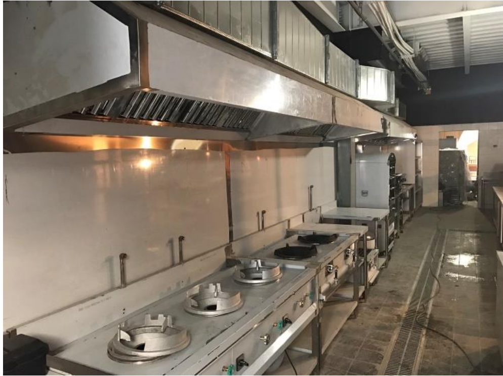
圖5 廚房排氣裝置（示意）