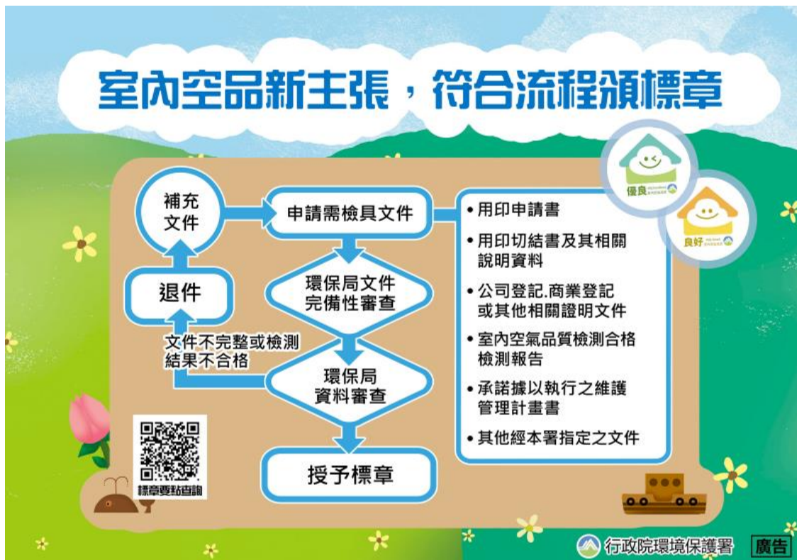
圖11 室內空氣品質自主管理標章申請流程