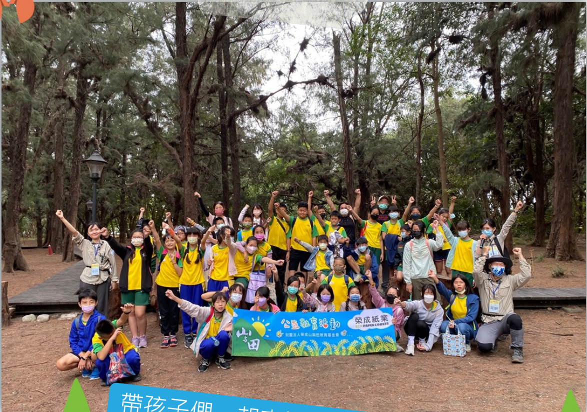
帶孩子們一起來認識海岸森林吧！