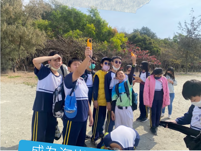
成為海岸森林的調查員