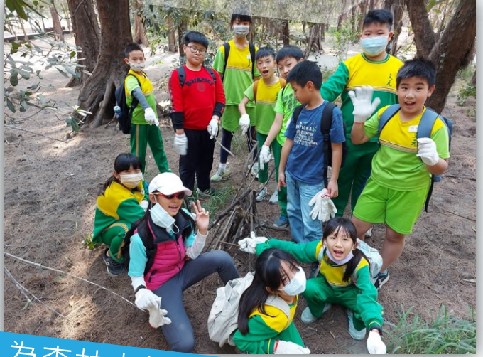
為森林中的生物搭一個避難所