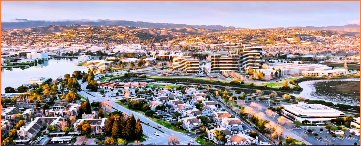
矽谷之旅 Silicon Valley