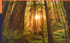
穆爾國家森林公園