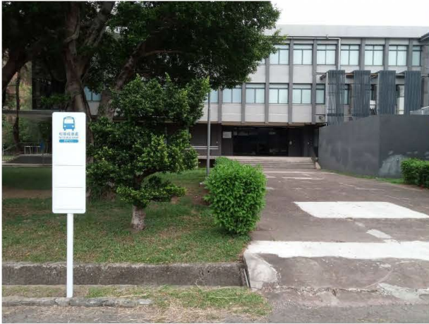
1、博愛校區實驗動物中心