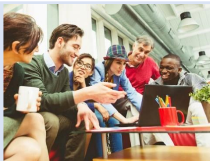
各國同學一起上課