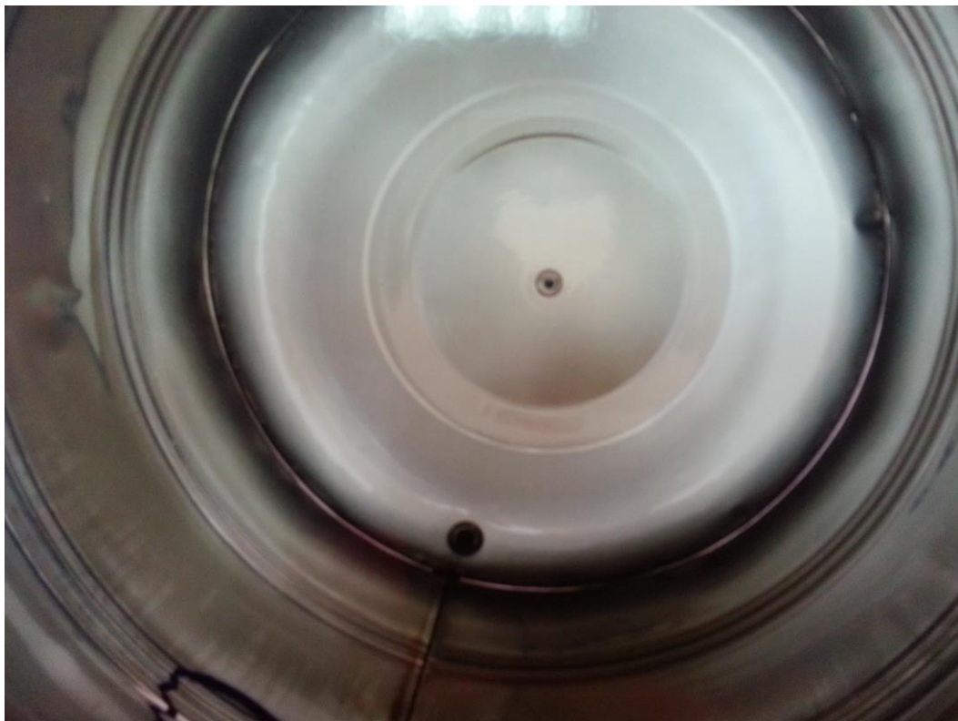
水塔每半年清洗一次--水塔清洗後