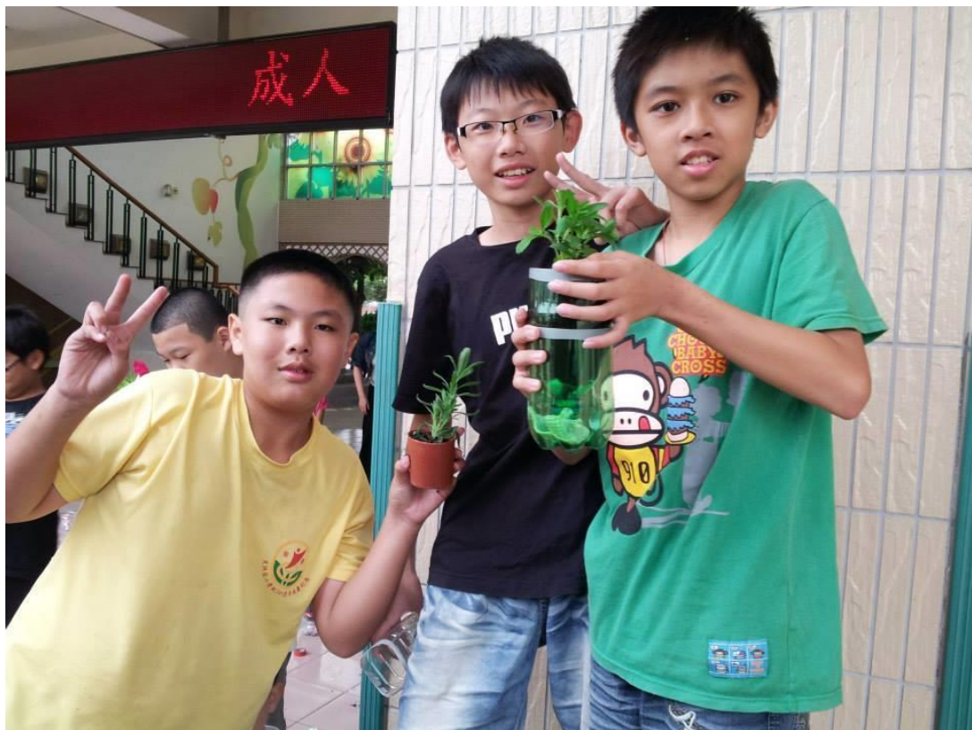
學生利用寶特瓶進行校園美化綠化