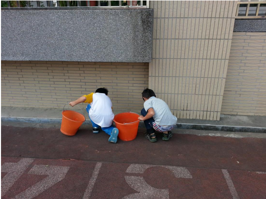
學生協助校園打掃