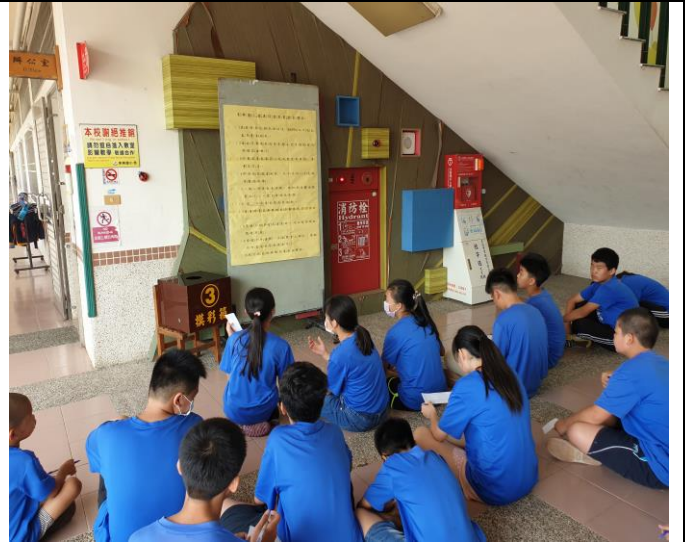
健康促進有獎徵答