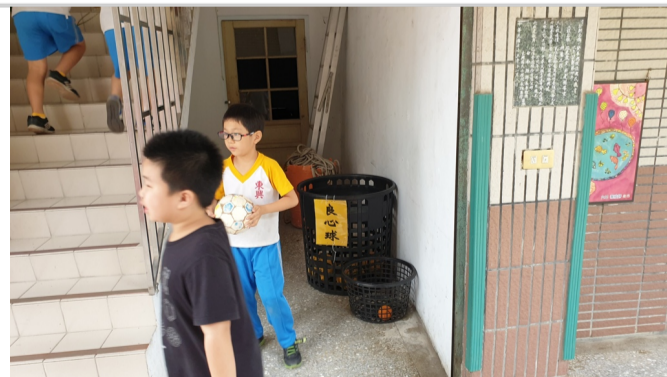
學校提供良心球讓學生下課利用