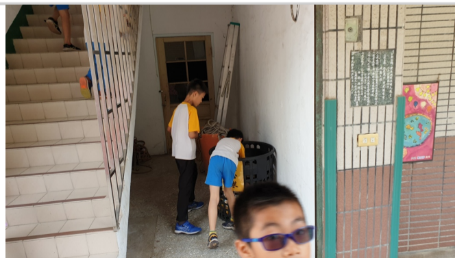
學校提供良心球讓學生下課利用