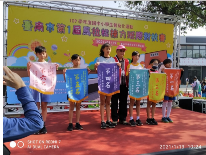
五年級乙組第三名