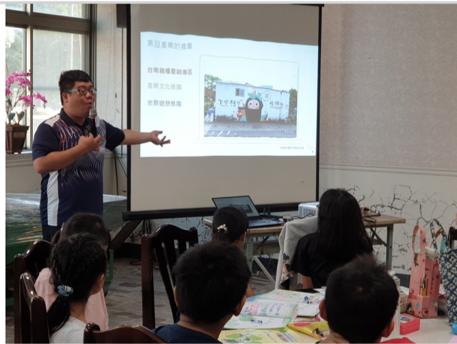
認識在地雜糧作物