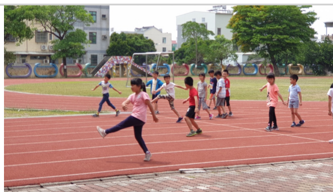
下課運動減少用眼時間