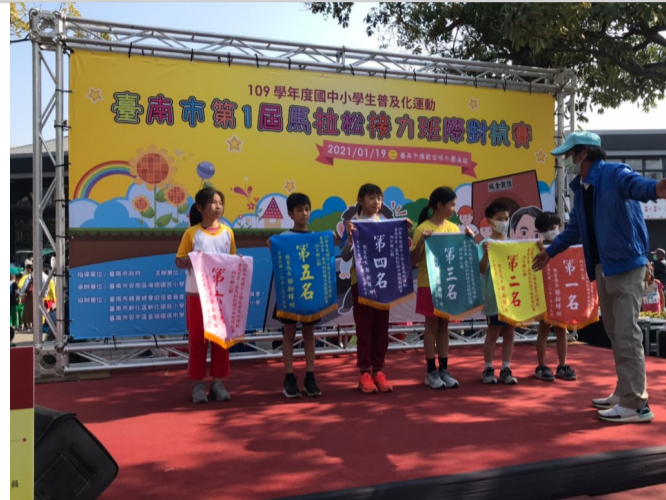
四年級乙組第六名