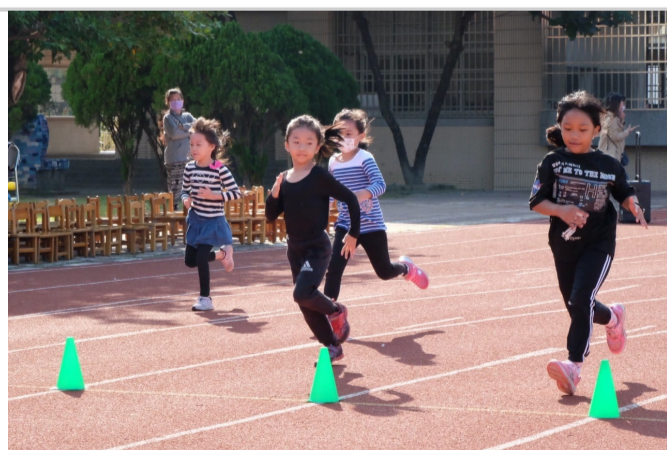
進行體育週減少用眼時間