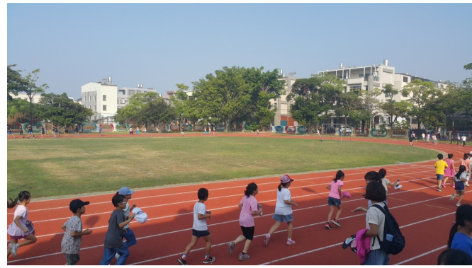
早上學生操場運動