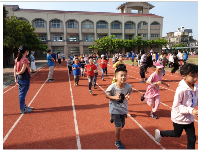
早上學生操場運動