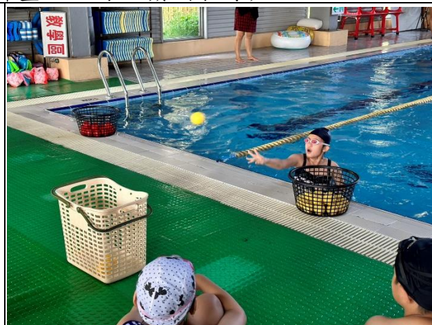
說明：趣味水中神射手