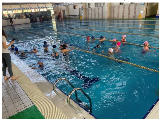
說明：趣味競賽—水底摸象