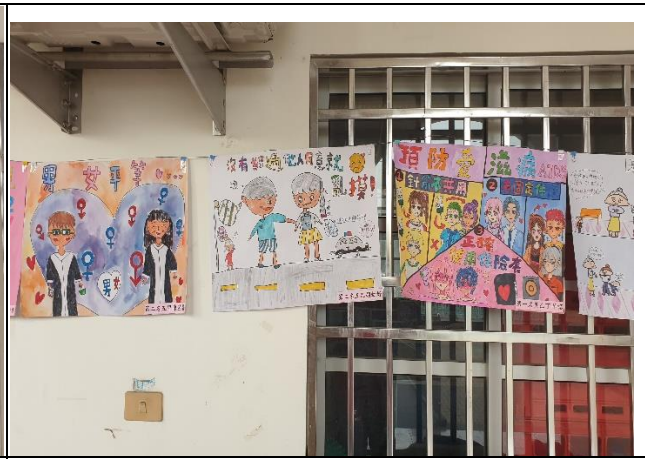
說明：健康促進學藝作品展示在玄關前