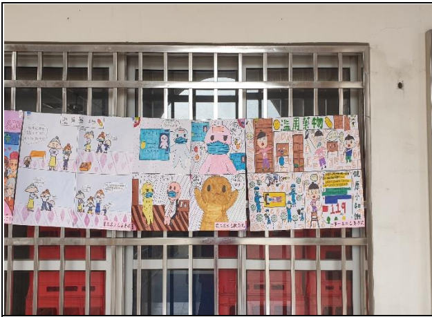
說明：健康促進學藝作品展示在玄關