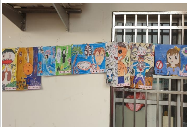
說明：健康促進學藝作品展示在玄關