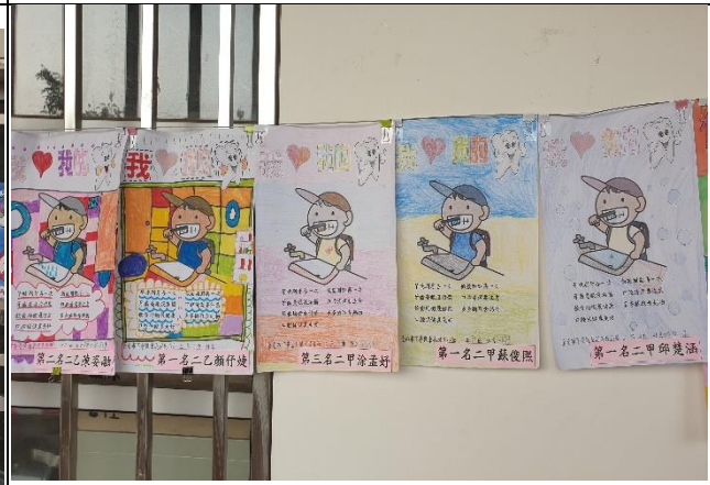
說明：健康促進學藝作品展示在玄關前