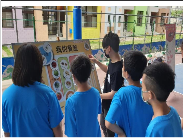
說明：我是健康小廚神