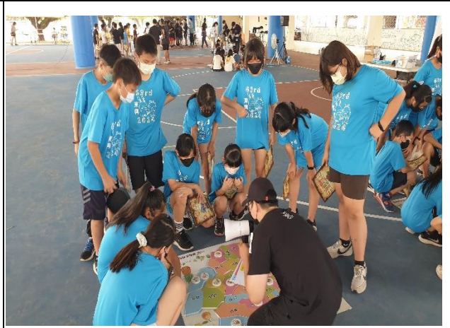
說明：我的家鄉種什麼