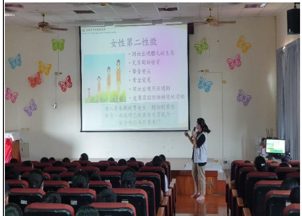
說明：介紹女生第二性徵