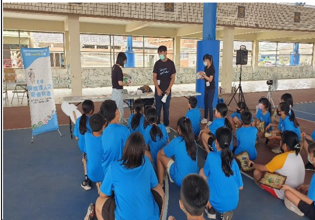
說明：採購達人明察秋毫