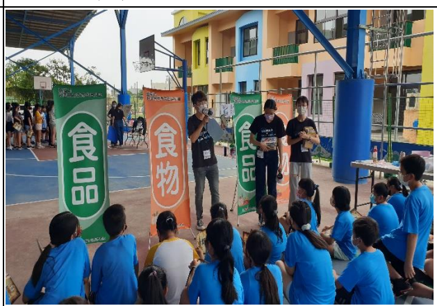
說明：戴上你的分類帽