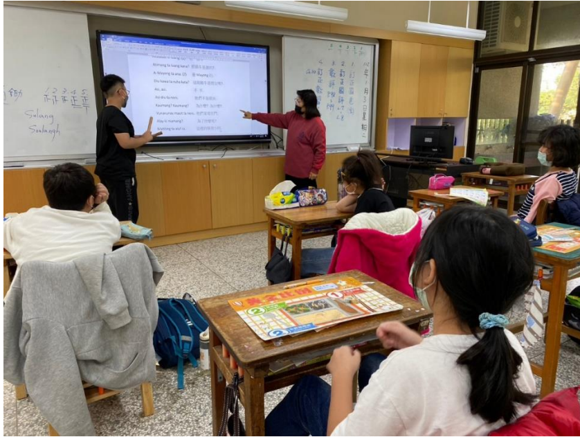
西拉雅語-課堂上練習唱誦西拉雅歌曲