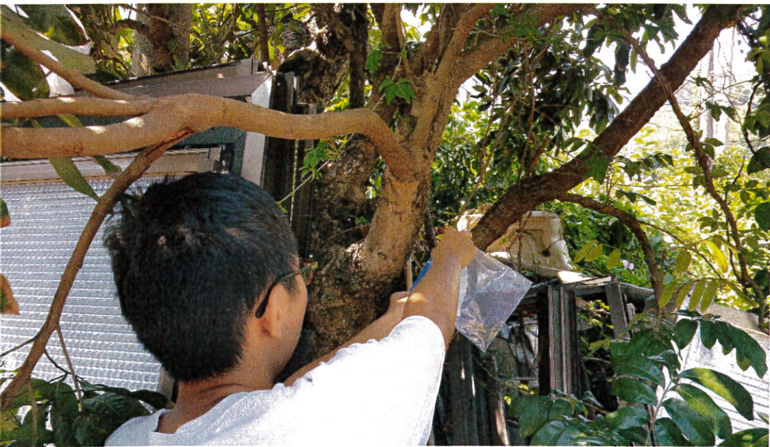
圖六、使用夾鏈袋自龍眼雞斜後方緩慢接近，引蟲跳入袋內