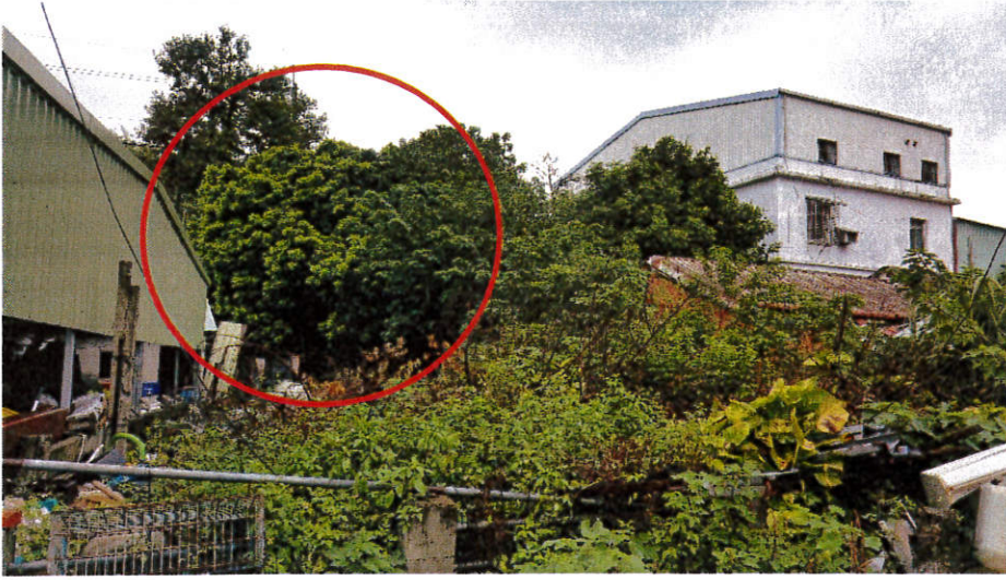
圖二、龍眼雞發現地點案例 1：民宅後院之龍眼樹，周圍有建築物遮蔽