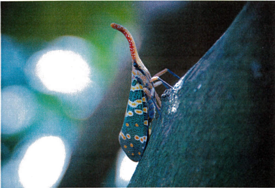
圖一、龍眼雞成蟲綠色前翅綴有鮮黃斑點，頭部前方具向上彎曲的細長吻狀突起，長吻上有許多白色小斑點

龍眼雞 Pyrops candalarius 屬半翅目、蠟蟬科，為植食性昆蟲，主要侵害龍眼、荔枝，也可能會在龍眼、荔枝周遭之台灣欒樹、烏柏樹、芒果樹、橄欖樹、梨樹及柑橘科植物如柚子樹上棲息取食，吸食樹幹枝條的樹液，當族群密度太高時會影響龍眼、荔枝養分運輸，促使樹勢衰弱、枝條枯乾並使果實品質低劣甚至落果。龍眼雞習性不喜歡離開棲息的樹木，不會叮咬人獸，也不帶有毒性或毒液，請民眾不須過度恐慌。龍眼雞成蟲能飛善跳，常見停留在樹木主幹及粗壯枝條，如發現龍眼雞，請不要任意採集，也切勿任意遺棄該蟲活體，可撥打(02)3343-2064 通報農委會防檢局或縣市政府農業局。