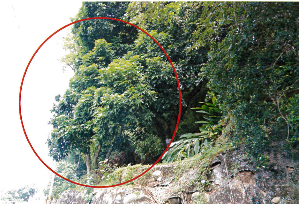
圖三、龍眼雞發現地點案例 2：坡地避風處之龍眼樹