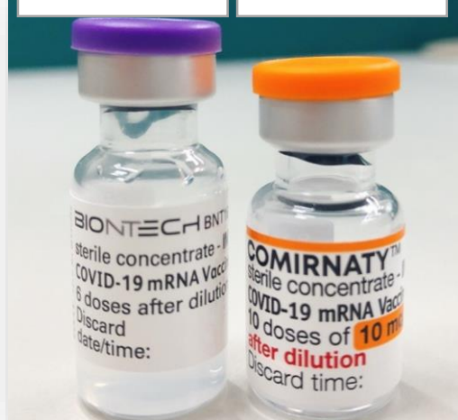
成人劑型 兒童劑型