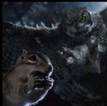
隱藏國度：天空下 Hidden Kingdoms: Under Open Skies 英國 / 59分鐘

透過迷你體型動物的眼光，本片帶 著我們進入一個獨特而未知的縮小版 世界。非洲疏林草原上的象龜與澳洲 索諾蘭沙漠的食蠍鼠是本片的主角， 除了擁有獨特的生存方式之外，眼中 所見到的，應該也有不同的世界觀吧！ 製作團隊設計了許多道具與場景， 運用各種攝影手法以及充滿戲劇性的 表現方式，讓觀眾進入這兩種迷你動 物的世界中，用前所未有的尺度，觀 看另一個視角中的自然環境與挑戰。