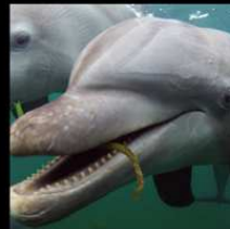
間諜海豚 Dolphins - Spy in the Pod 英國 / 59分鐘

《臥底企鵝》獲奧團隊透過13個全 新聞攝生動物進行拍攝，包括間諜海 豚、鸚鵡螺和鮭魚等其他身體絕技的 密探特工，潛入瓶鼻海豚以及飛旋海 豚群中，貼身探視這群海洋中最聰明 的動物，牠們的秘密生活，製作團隊結 合了海洋生物知識，以及用心設計製 作的工藝，帶著嶄新的生態紀錄片拍 攝方式潛入海洋之中，充滿許多觀眾 意想不到的巧思，處處可以發現驚喜 ，更能在歡笑中瞭解海豚的生態。