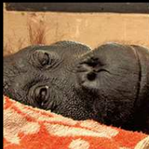
GREEN的故事 Green 法國 / 48分鐘

在這部沒有旁白的紀錄片，憑藉影 像與聲音，帶來最震撼的衝擊： Green是一隻孤獨的紅毛猩猩，生 活在沒有森林的世界。原本的家園，被 轉化為木料、棕櫚油送往異國換 取金錢。在全球化的時代，野望影展 期待透過本片，了解環境保育不是自 拍門前客。即使發生在遙遠國度的破 壞都與我們息息相關，一隻紅毛猩猩 的哀傷眼神儘管無聲，卻有著更勝千 言萬語的深遠影響。