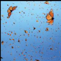
帝王斑蝶的旅程 Flight of the Butterflies 加拿大 / 44分鐘

WildView Taiwan Film Festival in association with Wildscreen