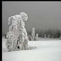
森林：陰影國度 The Forest: Realm of Shadows 德國 / 43分鐘

森林往往帶給人們想像，森林裡總 是有著奇特的故事。森林往往給予人 們瀟灑、幽靜的意境，但那卻是人類 介入之後才變成的樣貌。儘管如此， 改變後的森林仍有許多令人驚喜的生 態。在台灣，各地皆有不同規模砍伐 之後的再生林，那造成了什麼樣的變 化，而人們又該如何看待已非原貌的 森林？回顧本片，再次進入森林的故 事。