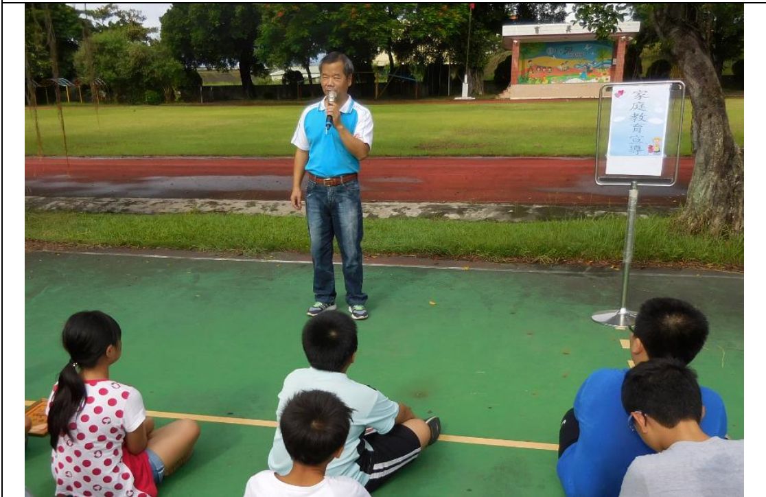
宣導家庭教育相關資訊