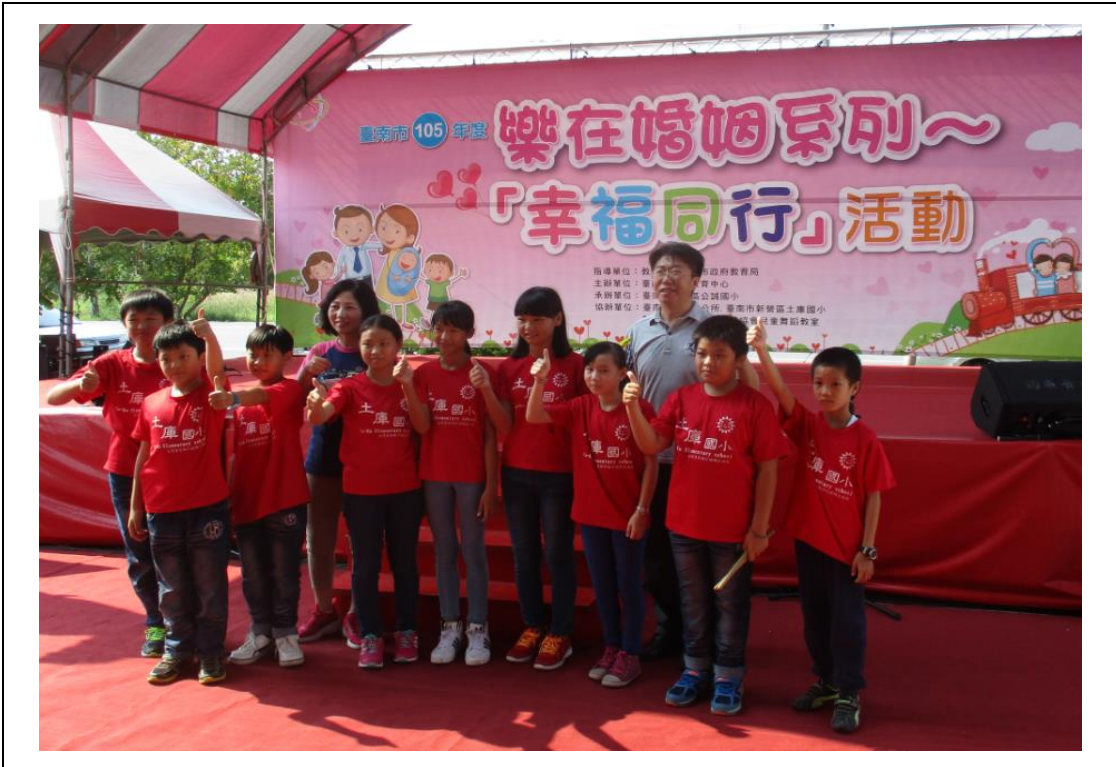
協助推動家庭教育中心業務