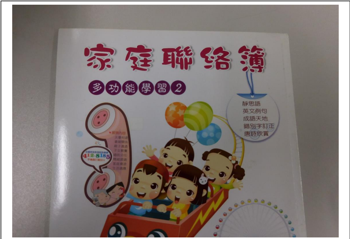
善用家庭聯絡簿推廣家庭教育諮詢專線