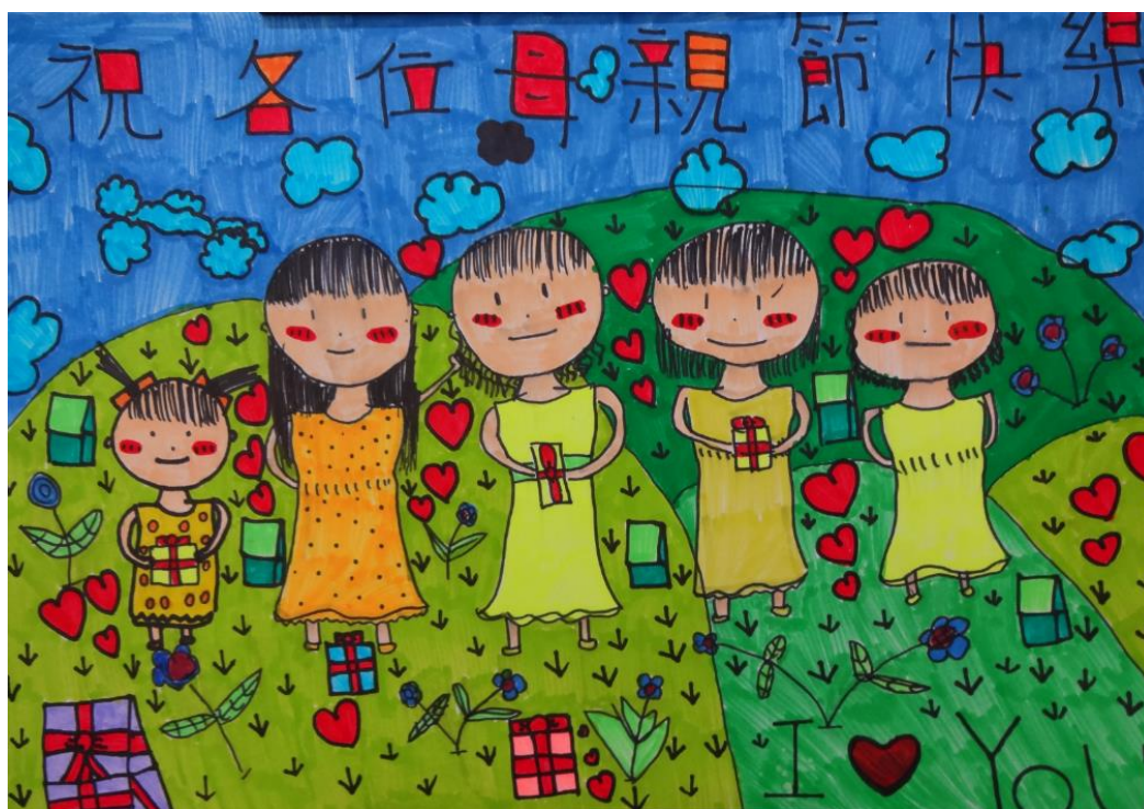
慈揚基金會母親節繪畫比賽參賽作品