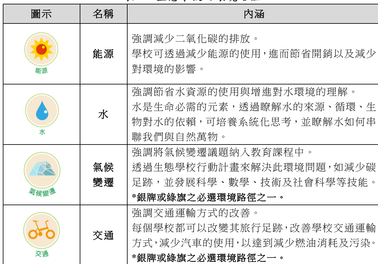
表 1、生態學校之環境路徑

學校在執行生態學校 7 大步驟時，依據不同認證級別，須選擇至少 1 至 3 項環境路徑作為生態行動計畫之主題。