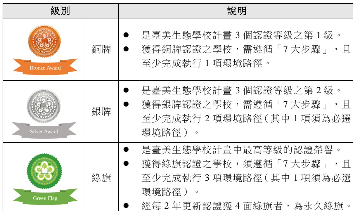
表 2、生態學校之認證級別

認證制度亦依我國環境特色進行在地化修正，發展出適合我國之生態學校系統，故欲取得銀牌和綠旗認證之學校，須於必選環境路徑（交通、消耗與廢棄物、氣候變遷及永續食物等4項）挑選至少1項，並展開行動，以回應我國環境議題現況及特色。