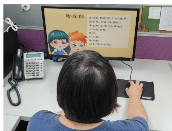
圖1 一同出遊稅樂趣 ( 動畫 ) 閱讀學習照

二、於本處兒童網/租稅魔法屋/租稅動畫館或租稅魔幻書，國小學生完成觀看「我是稅務小尖兵」、「一同出遊稅樂趣」( 動畫或漫畫 ) 教材資料，並上傳閱讀課程學習之照片，參考範例如下圖：