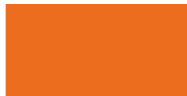
副色 - 鳳凰花橘色 C0 M70 Y90 K0 PANTONE 165C