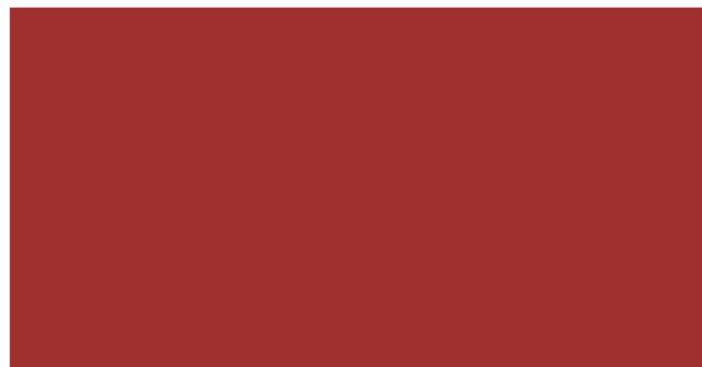
主色 - 臺南孔廟紅色 C30 M90 Y80 K20 PANTONE 193C