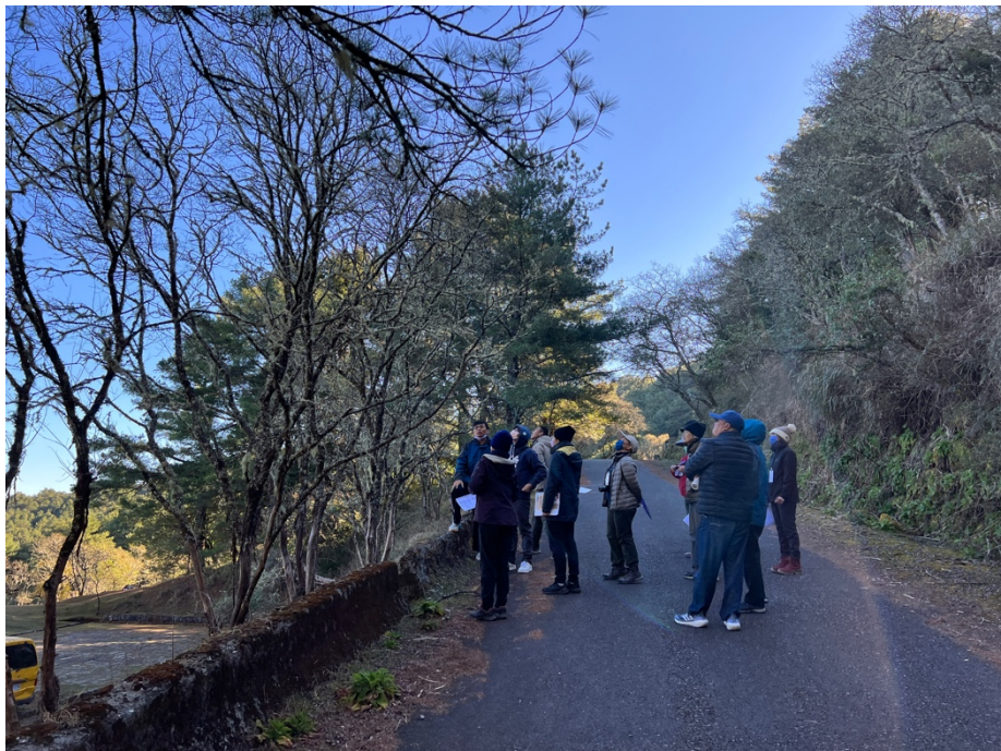
圖 2：塔塔加地區科學教育活動實地生態觀察