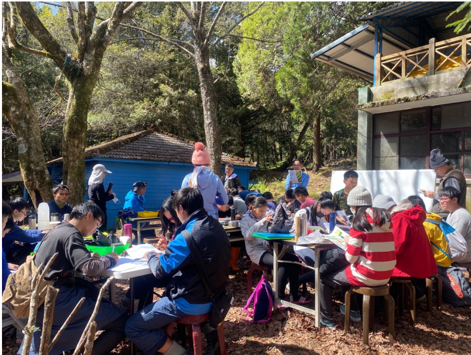
圖 1：樟湖生態國民中小學於塔塔加楠溪保育研究站辦理科學教育活動

當地豐富的教育資源，並將既有教案轉化為其他更多元的教育內涵。另預定在 10-11 月號召參加過工作坊的教師，一同帶著學生到塔塔加進行科學探究實作，以身歷其境感受玉山園區豐富的生態之美。希冀廣大的玉山園區可以成為國人重要的在地學習場域。