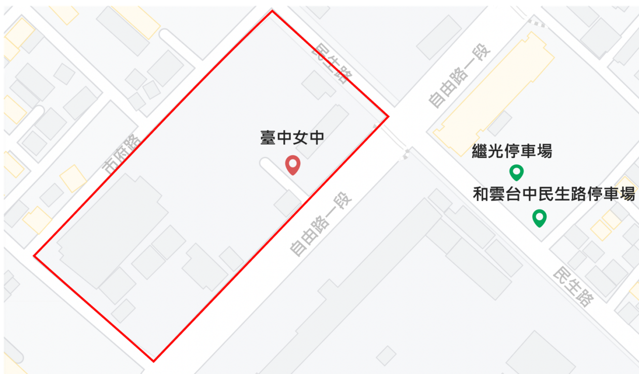
圖 2 臺中女中（9月6日實體說明會）周邊停車場地圖