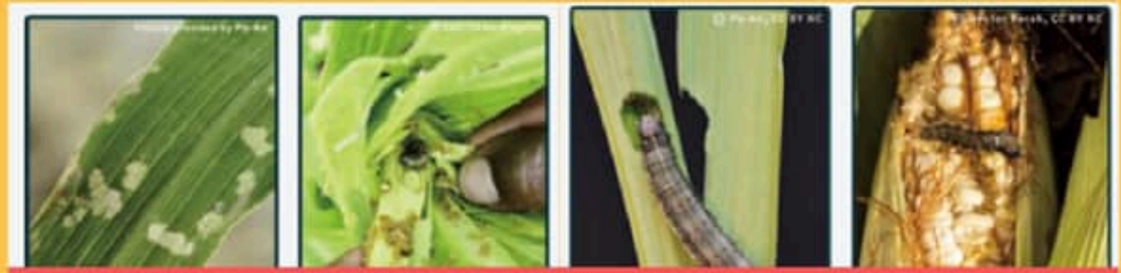
1齡幼蟲造成透明窗格紋啃食痕跡