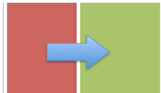
轉換觀點重新看待行為