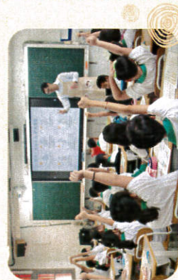
小朋友現場踴躍參與