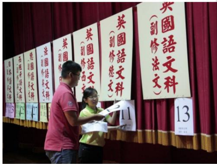
五專優先免試入學，明年試辦電腦填志願，一改傳統的撕榜方式。圖為文藻外語大學五專撕榜畫面。

2017-07-31 23:36 聯合報 記者馮靖慈／台北報導 讚 3 分享 傳送